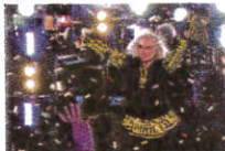
Debbie Harry.

Blondie är årets mottagare av NME:s musikpris med den blygsamma titeln "Godlike genius award". Bandets frontfigur Debbie Harry skriver på Twitter att hon är "oerhört smickrad" över utmärkelsen.