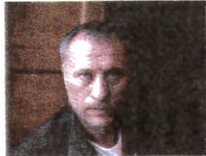
Michael Nyqvist.

Michael Nyqvist är klar för en huvudrollerna i tv-serien "100 Code". Enligt Deadline kommer "Lost"-stjärnan Dominic Monaghan att göra den andra huvudrollen.